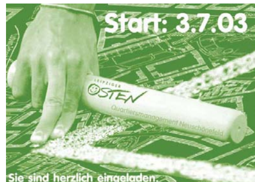
Titelblatt des ersten Quartiersrundbriefes

Für die Information der Bevölkerung im Stadtteil Neuschönefeld wurden Rundbriefe in einer Auflagenhöhe von 3.000 Exemplaren angefertigt. Sie enthielten die wesentlichen jeweils aktuellen Projekte des Quartiersmanagements, Angebote sowie Termine im Treffpunkt Kohlgarten. Die Rundbriefe wurden in alle Hausbriefkästen im Quartier verteilt sowie an öffentlich zugänglichen Orten (zum Beispiel Geschäfte in der Dresdner Straße) ausgelegt. Anfangs erschienen drei, später zwei Rundbriefe jährlich.