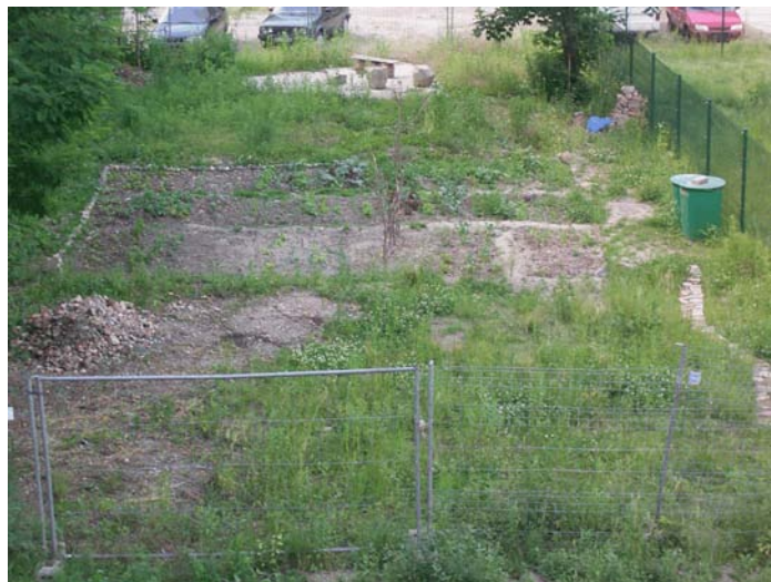
Temporäres Gartenprojekt in der Bergstraße 5

Der Stadtteil Neuschönefeld hat im gründerzeitlichen Teil zahlreiche Flächen, die derzeit nicht genutzt werden. Sie sind in der Regel bewachsen und unterschiedlich stark vermüllt. Bereits vor dem Start des Quartiermanagements hatte das Büro bgmr aus Berlin im Auftrag der Stadt Leipzig versucht, Nutzer für ausgewählte Brachen im Stadtteil zu finden. Dabei stand eine mögliche gärtnerische Nutzung im Fokus. Das Quartiermanagement übernahm das Thema, nachdem der Auftrag für bgmr endete. Dadurch konnte beispielsweise ein experimentelles Gartenprojekt eines Architekten weiter unterstützt