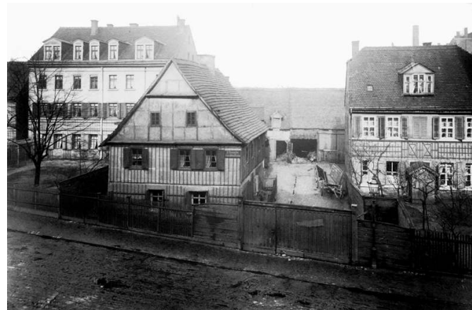
Alter Bauernhof in der Kohlgartenstraße

Das Quartiersmanagement übernahm im Anschluss eine ergänzende Bildrecherche. Gestaltung und Druck der Broschüre wurden mit Mitteln des Verfügungsfonds "Soziale Stadt" finanziert. Die erste Auflage in Höhe von 1.000 Stück war innerhalb von drei Monaten vergriffen. Auch eine zweite, leicht überarbeitete Auflage ist inzwischen fast vollständig verteilt.