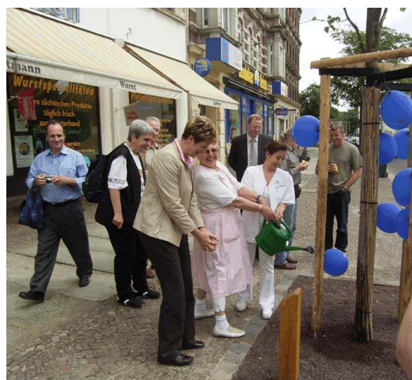
Angießen der gespendeten Straßenbäume