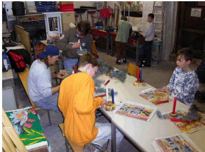
Kinder der Tagesgruppe des Fairbund e.V. in der Werkstatt

Die Resonanz der Anwohner blieb zunächst weit hinter den Erwartungen zurück. Dennoch war das Engagement der Projektbeteiligten konstant hoch. Beispielsweise wurden und werden der Aufbau, die Verwaltung und die Öffnungszeiten ehrenamtlich organisiert. Ab dem Sommer 2005 war eine spürbar stärkere Resonanz durch Anwohner zu verzeichnen,