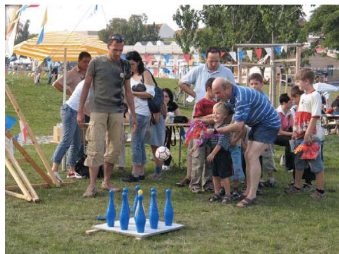
Neuschönefest 2005 im Rabet