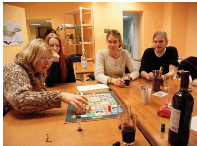
Veranstaltung in der Reihe Spieletreff