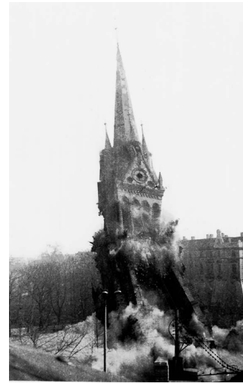
Sprengung der Markuskirche

Die Aufarbeitung der Geschichte des Stadtteils war ebenfalls ein Thema, das während des Bürgergutachtens angeregt wurde und auf starkes Interesse stieß. Da das Gebiet des Quartiersmanagements sowohl Neuschönefeld als auch Teile des ursprünglichen Reudnitz berührt, wurden beide Ortsteile in die Recherche einbezogen. In moderierten Runden trugen interessierte Anwohner Informationen, Bildmaterial, Texte und Biografien zur Geschichte des Stadtteils zusammen. Die Runden wurden vom Quartiersmanagement bewusst offen gestaltet, so dass viel Raum zum zwischenmenschlichen Austausch vorhanden war. Erst nach über einem Jahr entschied sich der Arbeitskreis, das zusammengetragene Material in einer Broschüre übersichtlich zu ordnen. Eine Praktikantin im Quartiersmanagement entwarf nach Vorgaben des Arbeitskreises Texte, die wiederum vom Arbeitskreis redigiert wurden.