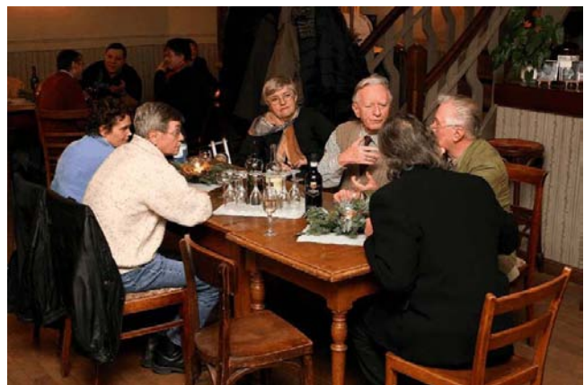
Mitglieder des Projektbeirates bei der Abschlussfeier

Gegen Ende der Projektlaufzeit wurde abgefragt, ob sich die im Projektbeirat Beteiligten auch nach Abschluss des Quartiersmanagements weiter in