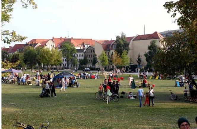
Neuschönepfest 2006 im Rabat

Für das Jahr 2007 ist eine Wiederholung im bisherigen Umfang fraglich, da absehbar ist, dass die entfallenden Ressourcen des Quartiersmanagements Neuschönefeld und anderer Projekte nicht ohne Weiteres durch verbleibende Akteure kompensiert werden können.