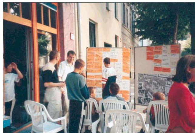
Befragung von Kindern und Jugendlichen im Jugendklub "Tante Hedwig"

Begleitend zur Entwurfsplanung für den Umbau des Stadtteilparks Rabet führte das Quartiersmanagement eine intensive Beteiligung von Kindern und Jugendlichen sowie Eltern durch. Dies fand in drei Etappen statt. Bereits vor dem Beginn der Planung wurden Kinder und Jugendliche im Park sowie in den umliegenden Schulen angesprochen und eine offene Sammlung des Veränderungsbedarfes durchgeführt. Die Ergebnisse wurden in den durch die Stadt ausgelobten Planungswettbewerb eingespeist. Nachdem der Siegerentwurf feststand, wurde dieser Rahmenplan zur Grundlage für eine zweite, intensivere Beteiligungsphase genommen.