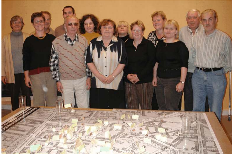
Teilnehmerinnen und Teilnehmer am Bürgergutachten

Die Ergebnisse der Befragungen, Analysen und des Bürgergutachtens wurden im Herbst 2003 zu einem Handlungskonzept verdichtet und in einer Wohnerversammlung öffentlich vorgestellt.