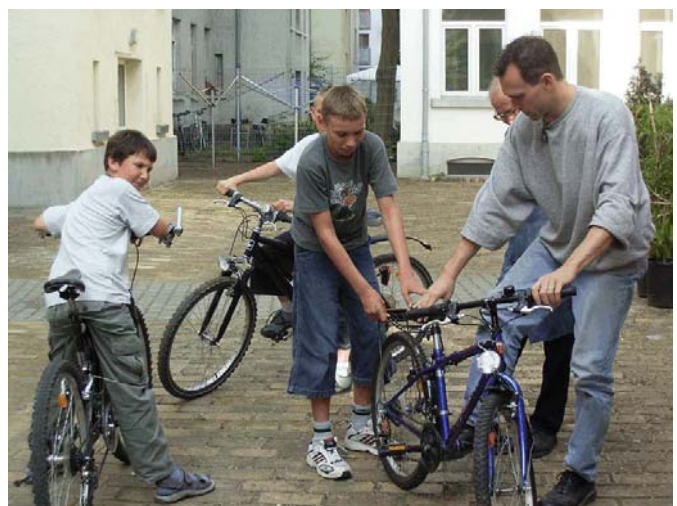
Fahrradreparatur auf dem Hof vor der Werkstatt