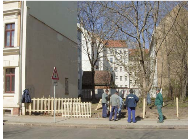
Einzäunung einer Brach durch das S.O.S.-Projekt

Nachhaltige Lösungen für Brachen gibt es jedoch nur bei dauerhaftem Engagement von Privatpersonen oder Einrichtungen.