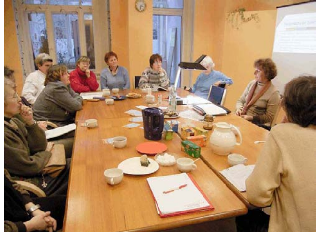
Vortragsnachmittag im Rahmen der Reihe Kaffeeklatsch

Der Treffpunkt war bis auf wenige Ausnahmen montags – donnerstags von 10 – 18 Uhr geöffnet. Diese ausgedehnten Öffnungszeiten konnten realisiert werden, weil es gelang, zusätzliche finanziell geförderte Arbeitsstellen zu akquirieren. So haben von Sommer 2003 bis Sommer 2005