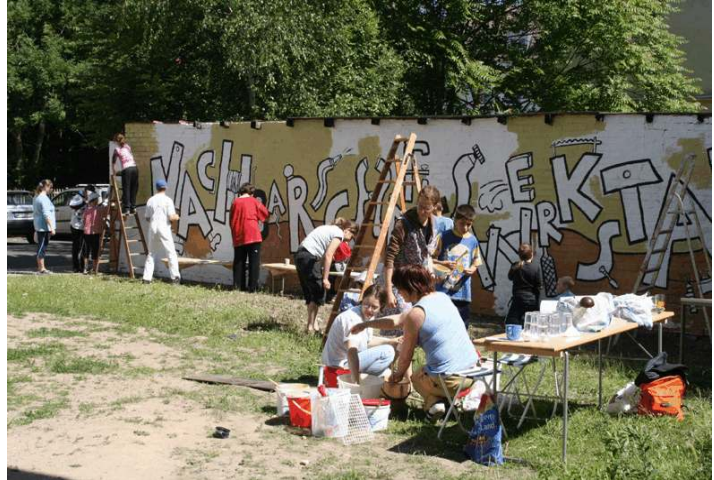
Gestaltung einer Wand in Kooperation mit dem Fairbund e.V.

Zu anderen Anlässen, beispielsweise dem Aktionstag "Gewaltfreier Stadtteil", wirkte das QM als Kooperationspartner für einzelne Aktionen mit. So wurde beispielsweise ein Projekttag mit der 125. Mittelschule durchgeführt, wo sich Jugendliche mit den Qualitäten und Problemen des Stadtteils auseinandersetzen.