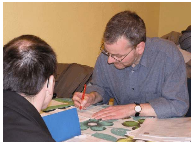
Beratung zu ALG II