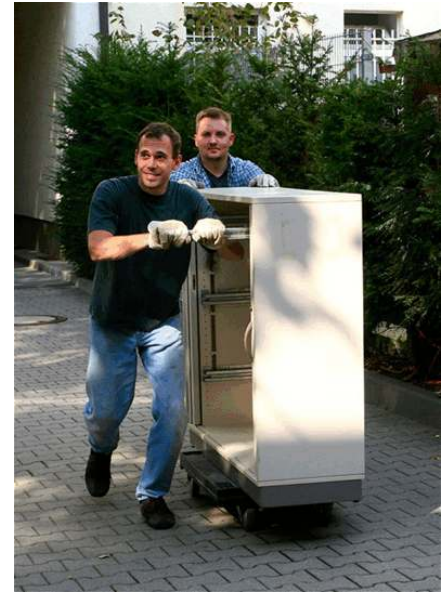
Umzug der Werkstatt

Angefangen von der intensiven Unterstützung einer heterogenen Projektgruppe bis hin zur Übergabe des Projektes an den Vorstand des neuen Vereins ist es hier gelungen, ein Projekt zu initiieren, zu begleiten und rechtzeitig an die Projektbeteiligten zu übergeben. Ein wesentliches Ziel des Quartiersmanagements ist damit erreicht worden.