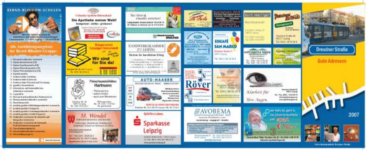
Gemeinsamer Werbeflyer der Händlergemeinschaft (Außenseite)

sich die Sorgen und Probleme der Händler an der Dresdner Straße. Erste Themenschwerpunkte waren beispielsweise vermüllte Grundstücke an der Anna-Kuhnow-Straße, die Einrichtung von Kurzzeitparkplätzen oder Informationen zum Umbau der Dresdner Straße. Später kamen weitere Themen dazu, beispielsweise die Begrünung der Straße oder die Entwicklung einer gemeinsamen Werbestrategie. Alle Themen wurden von den Gewerbetreibenden eingebracht. Zur Etablierung eines Netzwerkes von Gewerbetreibenden in Neuschönefeld nahm die Aktivierung anfangs einen großen Stellenwert ein. In persönlichen Gesprächen überzeugte das QM die Gewerbetreibenden von den Vorteilen einer Zusammenarbeit. Daneben übernahm das QM die Organisation, Moderation und Protokollierung der Treffen und lud oftmals externe Experten und Gäste ein. In der Folge der funktionierenden Vernetzung nahmen die Projekte der Gewerbetreibenden und damit auch der Kommunikations- und Abstimmungsbedarf zu. Das QM übernahm darauf hin stärker die Rolle eines Projektmanagers und fing damit einen großen Teil des Bedarfes auf. Beispielsweise organisierte und kommunizierte das QM die Aktion "Angießen", mit dem im Juni 2006 die Pflanzung von sieben Straßenbäumen gewürdigt wurde, die von Gewerbetreibenden gespendet wurden.